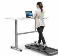
Tapis Roulant Elettrico Professionale Scrivania Workout

(ANSA) - ROMA, 14 MAG - S'inaugura Ubiliber, la casa editrice dell'Unione Buddhista Italiana che nasce "con l'obiettivo di promuovere la conoscenza della cultura, degli insegnamenti della filosofia e del pensiero buddhista attraverso la pubblicazione delle più significative opere presenti nel panorama internazionale". I primi titoli, disponibili a giugno in libreria e presso i rivenditori online sono: una nuova traduzione del Dhammapada, uno dei testi più importanti e amati del canone buddhista e 'Chiamami con i miei veri nomi', l'unica antologia poetica del Maestro Zen Thich Nhat Hanh. All'interno del portale ubiliber.it, che sarà online a partire dal 20 maggio, saranno disponibili approfondimenti, videointerviste con gli autori e curatori dei libri, podcast, playlist e un glossario per esplorare i termini più interessanti delle diverse discipline che compongono un'attività editoriale. Diretta da Emanuele Basile, la casa editrice presenta un catalogo con i grandi autori del pensiero buddhista accanto ad autorevoli esponenti meno conosciuti, alcuni dei