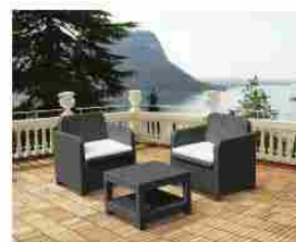
Salotto da esterni giardino poltrone Grand Soleil 2 posti